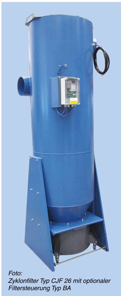
Foto: Zyklonfilter Typ CJF 26 mit optionaler Filtersteuerung Typ BA

Filtergehäuse ist in 2mm schwarzer Stahlplatte aufgebaut Oberfläche pulverlackiert RAL 5007/7011 Struktur