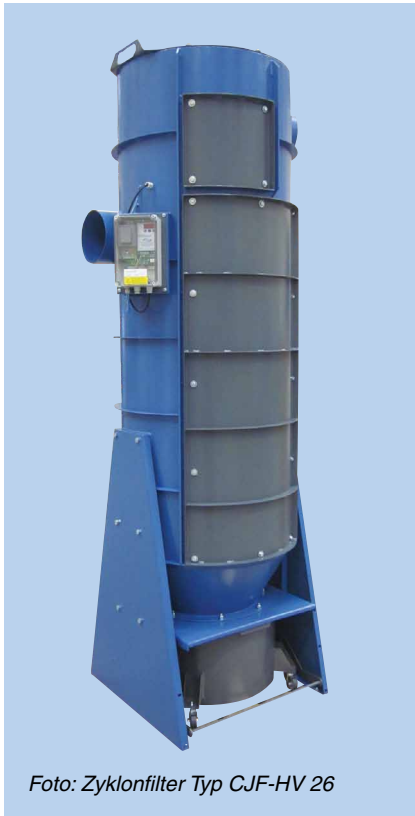
Foto: Zyklonfilter Typ CJF-HV 26